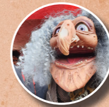
RAZEL C IE LUTKA