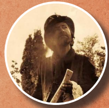
MUSIQUE HANTÉE MAXENCE DES OISEAUX