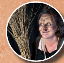
CORNICROCHU TISSEURS DE BRUME