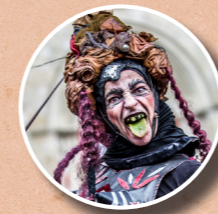
ABRACADABOUC C IE SONJÉVÉYÉS